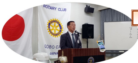
本日のプログラム