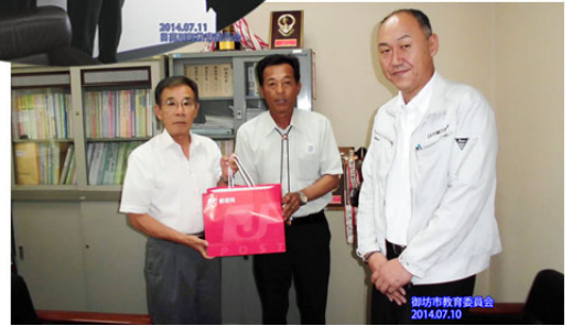
御坊市 教育委員会