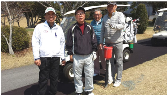
[3/23 御坊 RC60 周年記念ゴルフに参加してきました。]

ここでこの図を見ていると、大きな帝国も徐々に拡大しては行きますが無くなる時はあっという間になくなってしまいう事です。