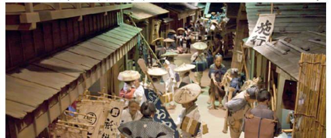
[江戸期おかげ横丁]

伊勢神宮のすぐ横には、おかげ横丁と言う古い街並みを再現した商店街がありまして、そこには日本一有名なお土産「赤福もち」本店がありまして、そこでお茶と赤福もちのセット ¥280円を食べて、夜は伊勢海老を堪能と言うほど頂きました。