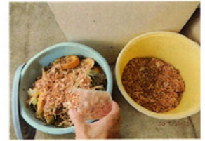
(ポットからバケツへ)