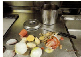
(野菜の生ゴミが出来る)